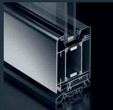
Schüco Tür ADS 70 SL.HI Schüco Door ADS 70 SL.HI

The new Schüco Door ADS 70.HI (High Insulation) combines outstanding thermal insulation with the benefits of the Schüco ADS door systems. The basic depth of 70 mm ensures a high degree of stability. Optional fittings allow it to be used as a multi-purpose door and integrated in the building security and building management system. The clear, timeless design is ideal for combining with the proven Schüco façade and window systems