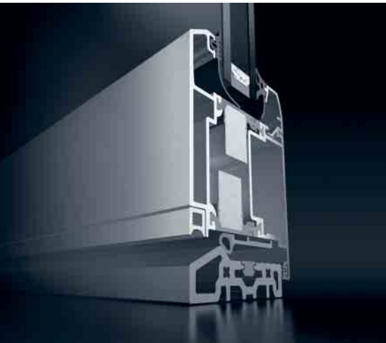
Schüco Tür ADS 70 RL.HI Schüco Door ADS 70 RL.HI