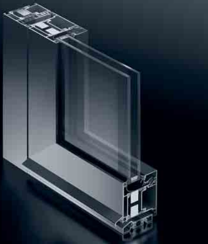
Schüco Tür ADS 70.HI Schüco Door ADS 70.HI

Die hochwärmegedämmte Tür eignet sich ideal für die Verbesserung der Energiebilanz eines Gebäudes – bei maximaler Planungsfreiheit.